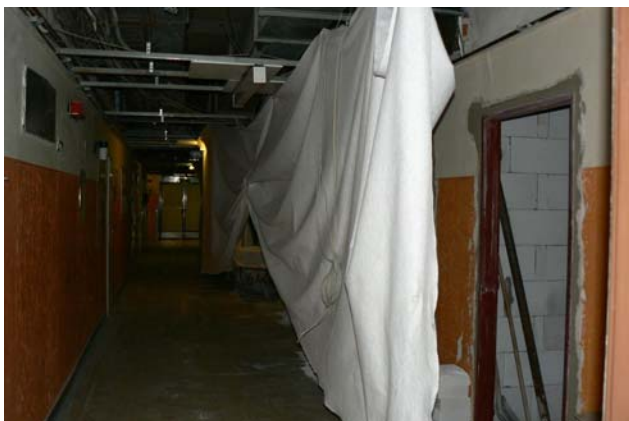
Chodba směr východ (předtím)