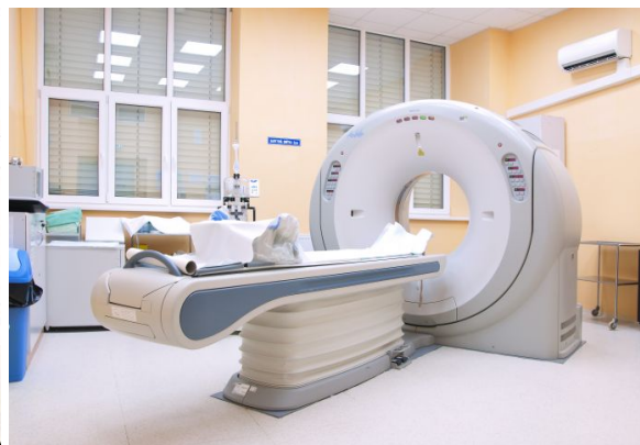
Toshiba Aquilion 16 - 16. 3. 2009