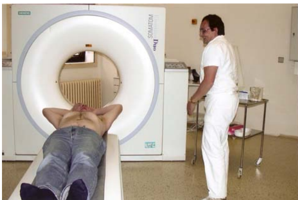
Siemens Somatom Duo – 19. 2. 2001

Velkou zásluhu, kterou měl pan primář, byla výměna CT přístroje. Kvůli častým problémům a opravám byl vyměněn starší typ CT Somatom Duo od firmy Siemens za novější typ Aquilion 16 od firmy TOSHIBA. V roce 2011 bylo provedeno cca 8600 CT vyšetření. K CT byl pořízen nový talkový injektor od firmy Ullrich, který je nemalým a spolehlivým pomocníkem.