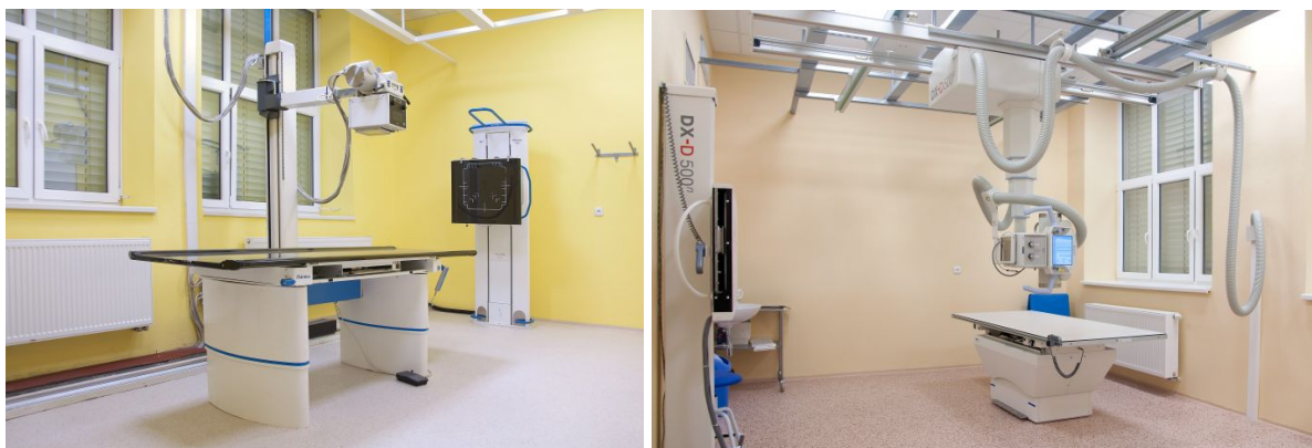
Chiraktis MP-50 Chirana (březen 2003)

Princip nepřímé digitalizace je v podstatě obdobný, jako tomu bylo předtím. Dříve se snímek udělal na kazetu a byl vložen do vyvolávacího automatu. Mělo to určité nevýhody. Dlouhá čekací doba na snímek, vyvolávací proces chemickou cestou a taktéž vyšší pořizovací náklady. V současné době je práce ulehčena a snímek se ukládá na kazetu s fólií, která se vyvolá v digitální čtečce, kde je následně snímek zpracován a odeslán do archívu (PACS) nebo e-PASCem odeslána do okolních nemocnic.