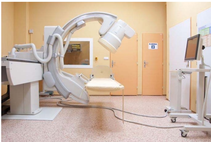
Skiaskopicko-skiagrafické pracoviště – Multidiagnost 4 Eleva

V roce 2008 byl pořízen nový UZV přístroj od firmy TOSHIBA. Na kterém se provádí UZV vyšetření prsou a uzlin. Od 1. 4. 2011 se rozšířilo spektrum prováděných vyšetření o UZV břicha a UZV krku. Dále se provádí i odběry bioptického materiálu, punkce tekutinových kolekcí pod UZV přístrojem. UZV vyšetření v roce 2011 bylo 1113.