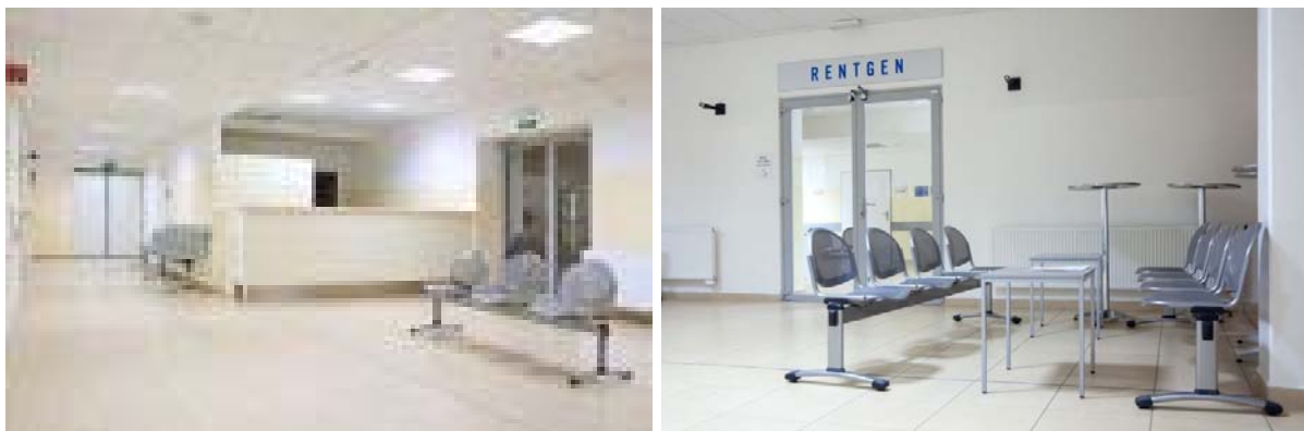
Chodba směr východ (potom)

Zaměstnanci i pacienti pracovali a nechávali se vyšetřit během přestavby. Období přestavby bylo velmi náročné až vyčerpávající, jak pro personál, tak i pro pacienty. Několik fotografií ilustruje, čím si oddělení a pan primář museli projít.