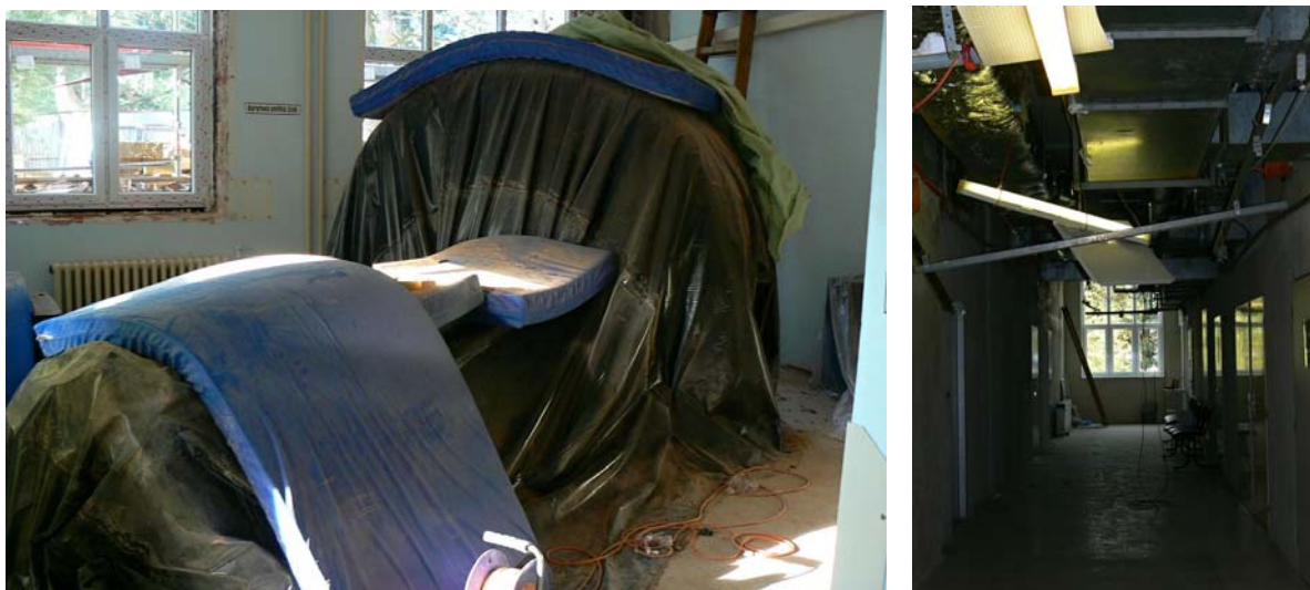
Výměna oken na CT pracovišti

Pan primář Chylík zemřel přesně 20 let po spuštění 1. CT v Táboře.