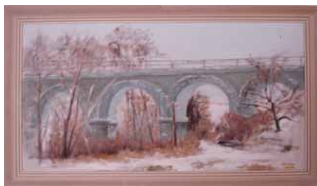
Vlastnoručně malované obrazy

Rádi bychom touto cestou poděkovali za projevy soustrasti a osobní účast při posledním rozloučení s našim drahým tatínkem a tchánem.