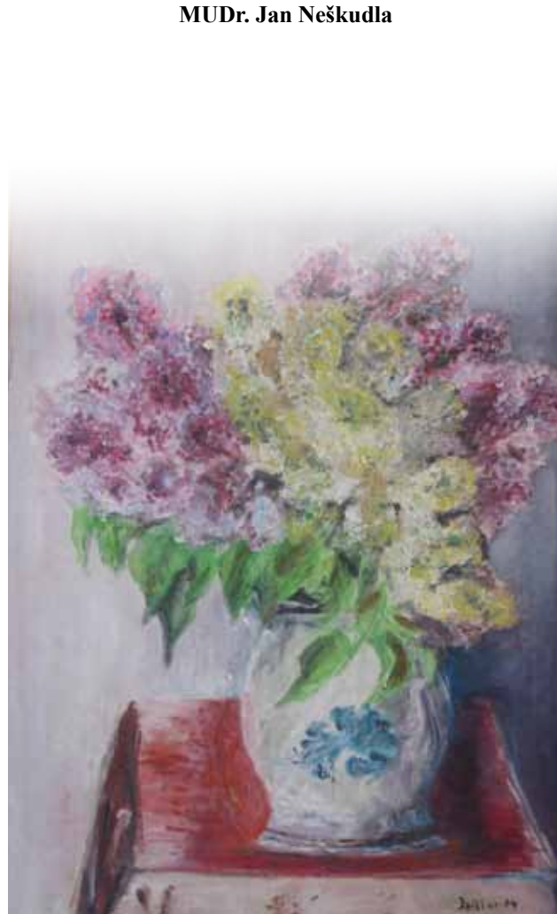
autor obrazu: Ivan Špiller