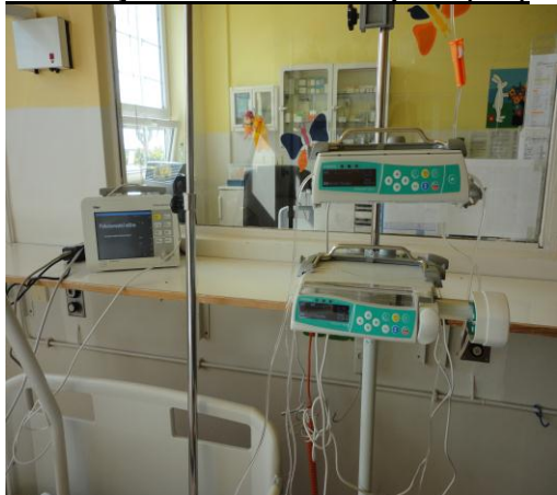
Dávkovač injekční, monitor novorozenecký