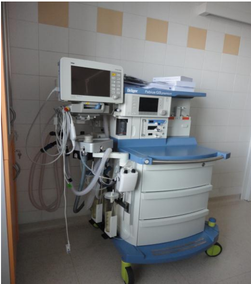
Anesteziologický přístroj + monitor