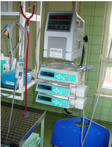
Lineární dávkovač, infuzní pumpa