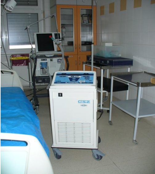
Přístroj pro řízenou hyper-a hypotermii