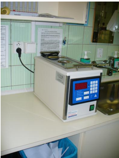
Ohřev infuzí a krve