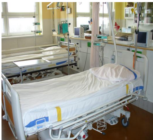
Resuscitační lůžko s laterálním náklonem