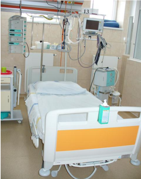
Resuscitační lůžko s laterálním náklonem, infúzní pumpy, injekční dávkovač, dokovací stanice, monitor bedside, elektrická odsávačka