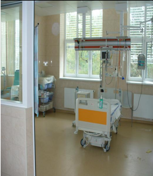
Lůžko resuscitační s laterálním náklonem, pumpa infuzní, dávkovač injekční