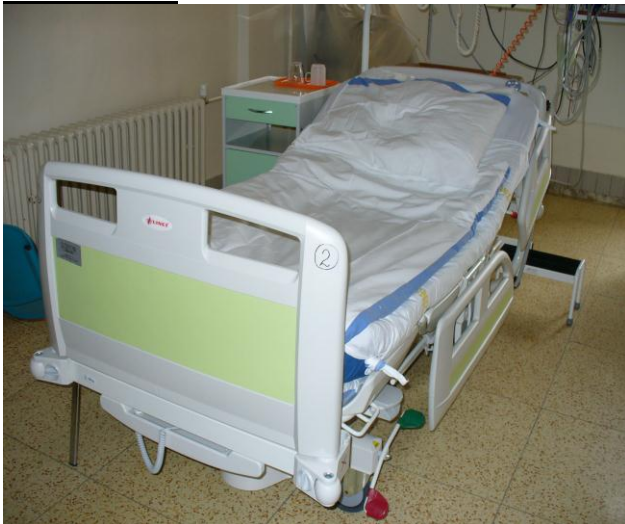
Resuscitační lůžko bez laterálního náklonu